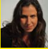
קרן איל מלמד