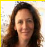
ענב שור - דיעי