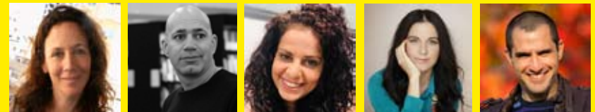
ענב שור - דיעי