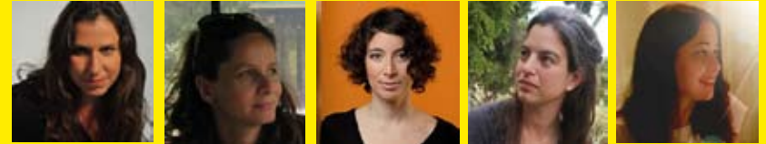
קרן איל מלמד